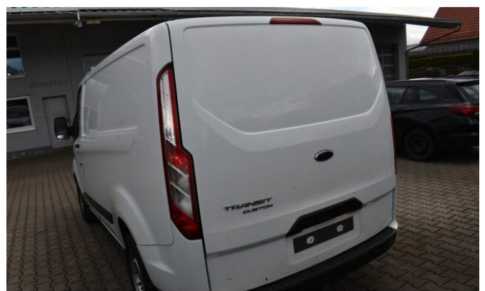
Bild vorab - Fahrzeug wird noch aufbereitet