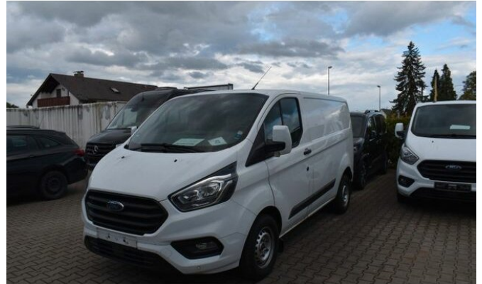
Bild vorab - Fahrzeug wird noch aufbereitet