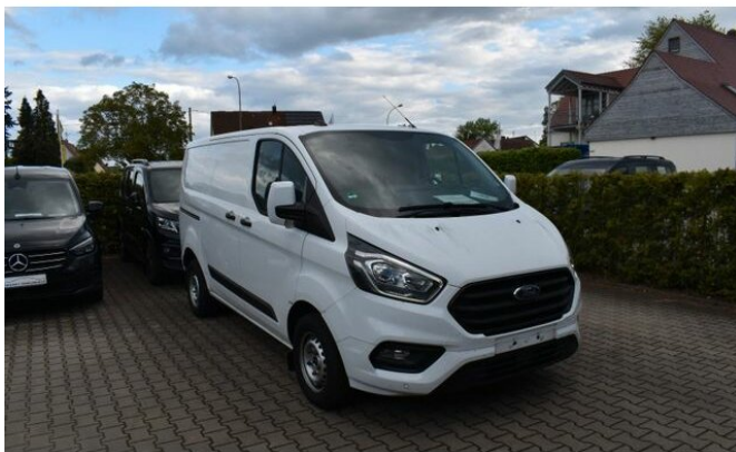
Bild vorab - Fahrzeug wird noch aufbereitet