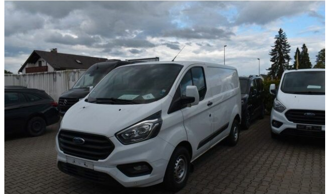
Bild vorab - Fahrzeug wird noch aufbereitet