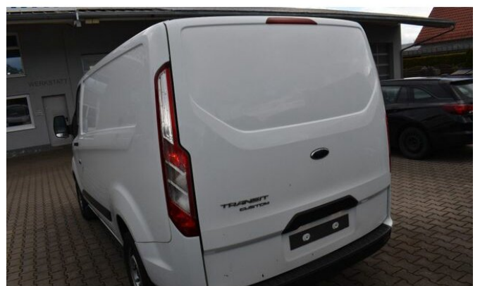
Bild vorab - Fahrzeug wird noch aufbereitet